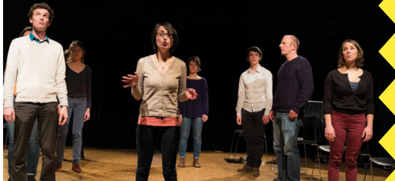
Atelier Prise de parole, récit et conte – avril 2015

Fondée en 2006, l'association étudiante vous propose chaque année de (re) découvrir des films oubliés du grand public et qui méritent une seconde chance.