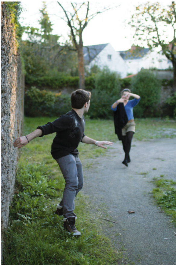
APPUI en images

Du 1 er septembre au 15 octobre // Présidence de l'université