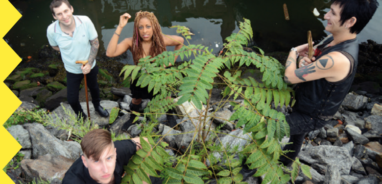
Cult of Youth