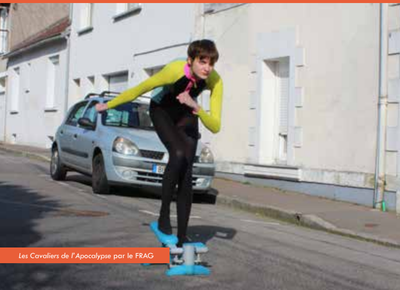
Les Cavaliers de l'Apocalypse par le FRAG

Plus d'infos : www.univ-nantes.fr/culture